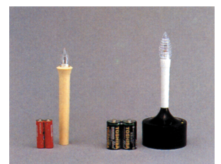
ローソク電池灯 (小) φ 17×170 ローソク電池灯 (大) φ 75×200